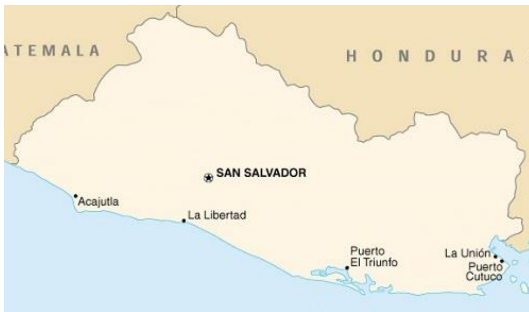
Gráfica 2: Mapa de puertos de El Salvador

clasificación que recibió el país está acompañada de una puntuación de 4, teniendo en cuenta que ésta va de 1 a 7 puntos posibles.